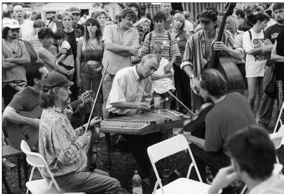
Träff Schötz organisiert Volksfeste im ursprünglichen Sinn des Wortes. So treten am «Gaukler-Träff» (1997) auf dem Buttenberg Strassenkünstler und Bands mitten unter 2000 Jodlern und Bluesfans auf.

fälle und eine entspannte Atmosphäre für Jung und Alt.